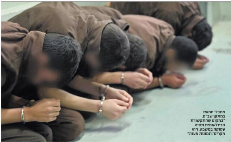
מחבלי אמס במחוקם שהתקשרות הבינלאומית תהיה עסקה במשפט, היא מקרינה תמונת מעורב

למנוחה. צריך להבין את הערך של משפט כאלתו - כחומר היצג שמנוגד נגד המדיניות הבינלאומית של ישראל והלגיטימציה למה שנעשה. משפט כזה הוא גם דרך להעביר את המסרים שלנו ולהציג את כל העובדות שאנחנו רוצים להציג לעולם, בדרך שהיא לא טיקטוק של חובר או מסביר, מוכשר ככל שיהיה אלא כזו שהעולם מכיר בדרך הכי יבשה, מסודרת והמוקדמת להציג טענות ולבחון אותן בגלוי. בכל התרבויות יש הערכה להליך המשפט בדרך לקבוע עובדות. לא תתם התרבות שלנו כוללת משפט בספרות, במחזות, בסרטים ובסדרות."